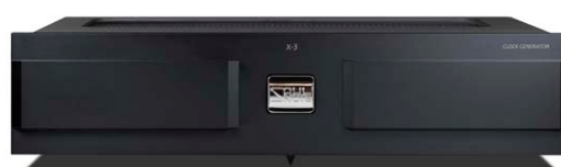
X-3 (プレミアム・ブラック)