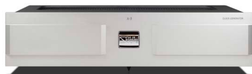
X-3 (プレミアム・シルバー)