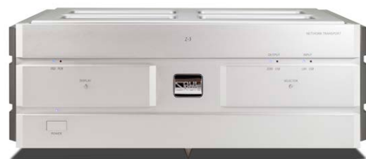
Z-3 (プレミアム・シルバー)