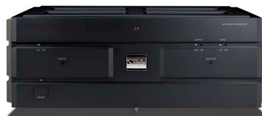
Z-3 (プレミアム・ブラック)