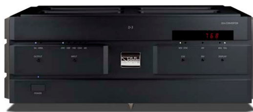
D-3 (プレミアム・ブラック)