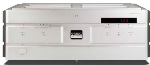
D-3 (プレミアム・シルバー)