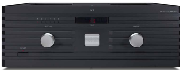
A-2 (プレミアム・ブラック)