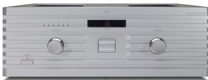
A-2 (プレミアム・シルバー)