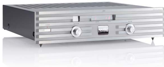
A-1 (プラチナム・シルバー)