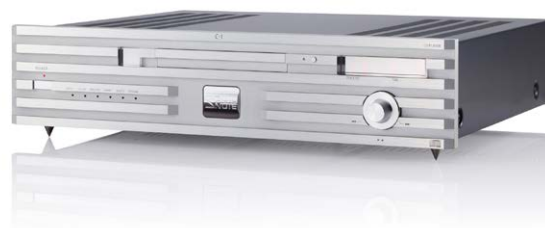
C-1 (プラチナム・シルバー)